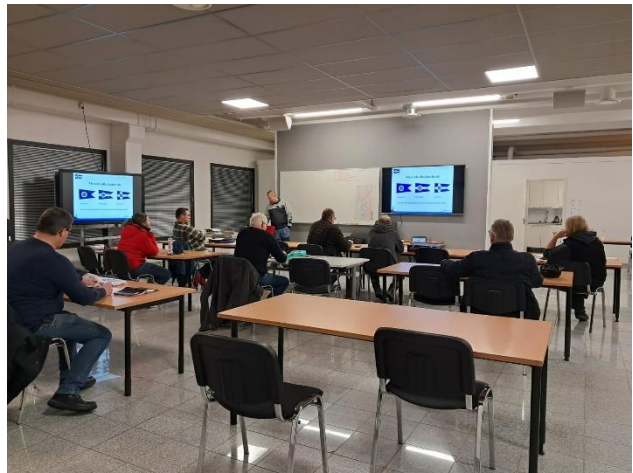
Kurssilaisia kevät 2025